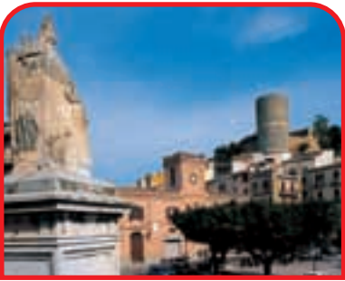
◀ Salemi: piazza Libertà e sullo sfondo il Castello Normanno de-