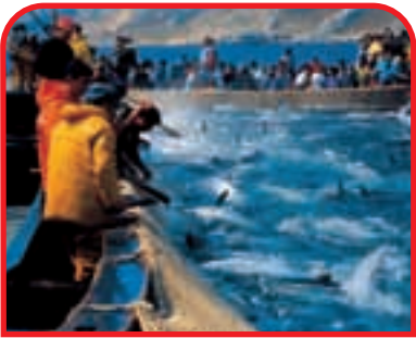
◀ Isole Egadi: Favignana, la tradizionale pesca del tonno - (ph Giò Martorana)