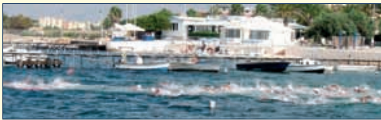
Circolo Canottieri Marsala - la partenza della gara di Triathlon