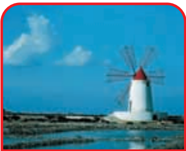
◀ Paceco - Mulino a vento