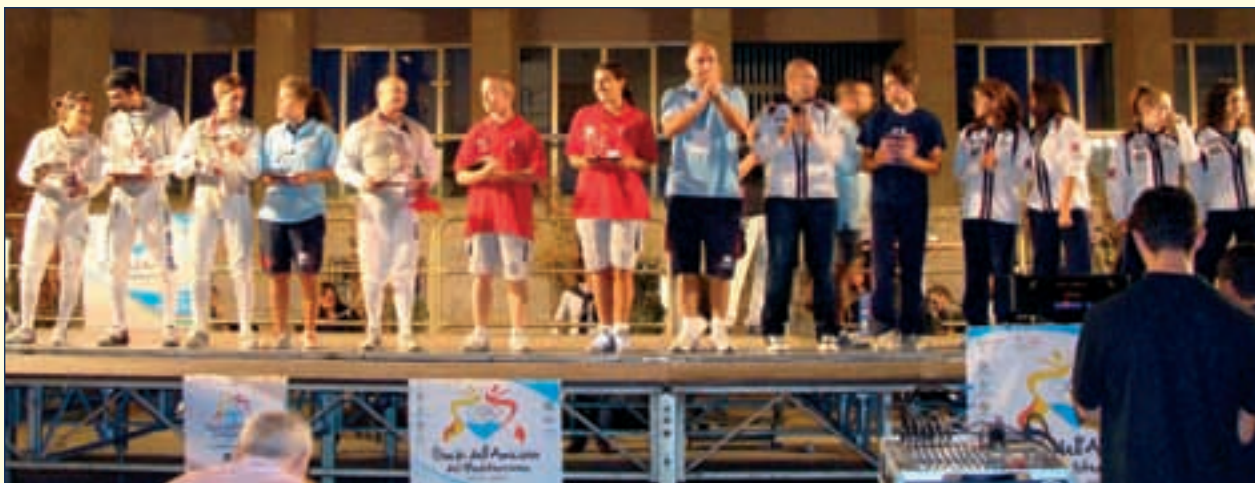
La cerimonia di premiazione della gara di Scherma svoltasi a Mazara del Vallo