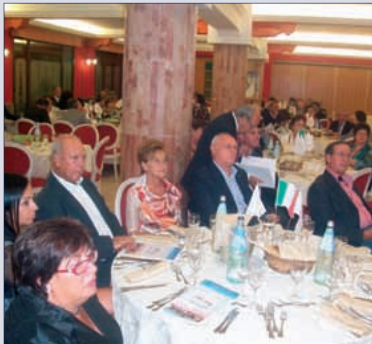
Una immagine della conviviale del Panathlon