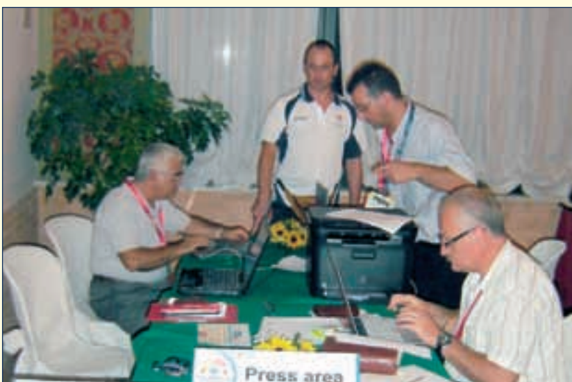
La sala stampa, costantemente presidiata dai giornalisti