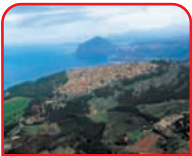
Erice: veduta aerea e sullo sfondo Monte Cofano