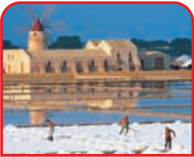
◀ Marsala: Riserva Naturale dello Stagnone, salina Inferna