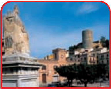
◀ Salemi: piazza Libertà e sullo sfondo il Castello Normanno de-