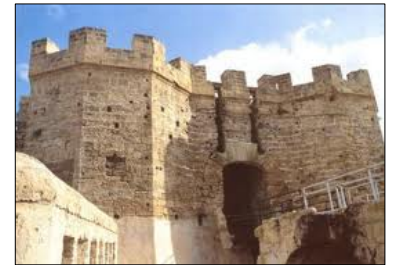
Castello a Mare (PA)

Questo genere di “rivisitazione” pseudostorica fa il paio con una non remota battuta (invero... sbarazzina) secondo la quale “Mussolini non aveva mai ammazzato nessuno; al massimo aveva spedito i suoi oppositori a villeggiare in ridenti località marine e montane.”