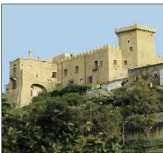
Castello di Carini