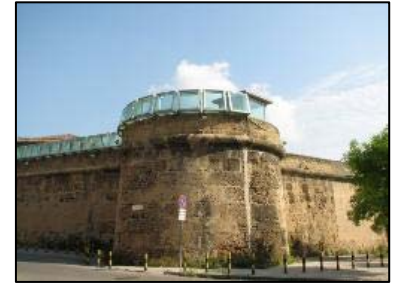
L'Ucciardone - Palermo