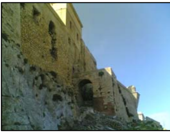
Favignana, Castello di S. Caterina