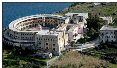
Isola di S. Stefano - Ventotene