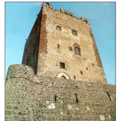
Castello di Adrano