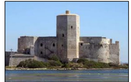
La Colombaia - Trapani