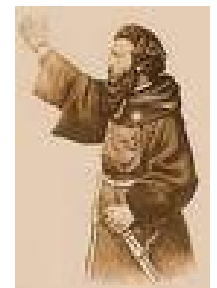
frate Giovanni Pantaleo

Se volete saper dov'è Mazzini,/ domandatelo all'Alpi e agli Appennini./ Mazzini è in ogni loco ove si trema/ che giunga a' traditor l'ora suprema./ Mazzini è in ogni loco ove si spera/ versar il sangue per l'Italia intera.