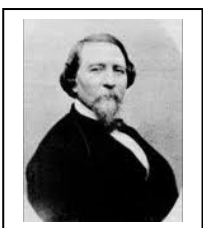
Giuseppe La Masa

Se volete saper dov'è Mazzini,/ domandatelo all'Alpi e agli Appennini./ Mazzini è in ogni loco ove si trema/ che giunga a' traditor l'ora suprema./ Mazzini è in ogni loco ove si spera/ versar il sangue per l'Italia intera.