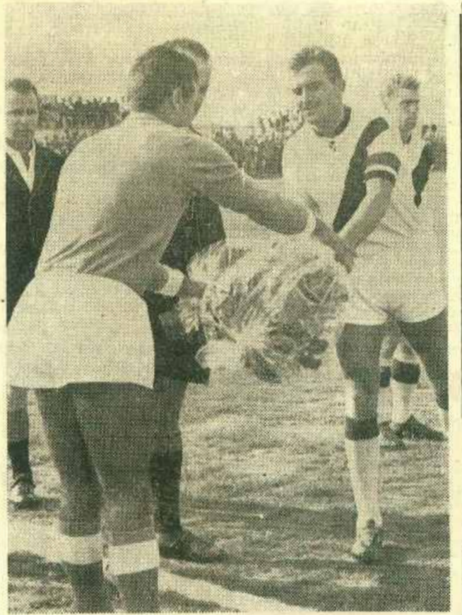
Scambio di fiori e cavalleresca stretta di mano tra i due migliori stopper del girone