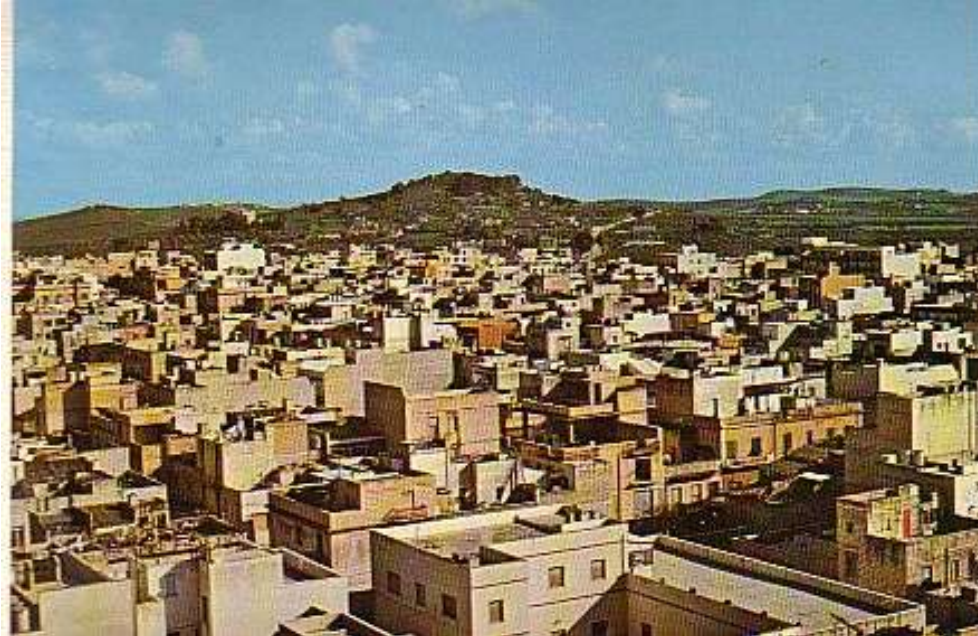
Panorama di Paceco Visibile sullo sfondo il Castellaccio

Per cercare di dare una risposta a questo quesito bisogna innanzitutto tenere presente che è sempre rimasto vivo nella famiglia Fardella il triste ricordo dell'assalto subito nel palazzo di Trapani, circa novant'anni prima, dai Ferro e dai San Clemente. In quell'occasione la vicinanza di una chiesa aveva favorito la loro salvezza. (12) In quel tempo si poteva sfidare anche la maestà del re o ribellarsi contro il sovrano, ma offendere o violare l'asilo di una chiesa o di un ordine religioso o monastico era una follia che non passava per la testa di nessuno. Ed anche adesso sull'erigendo paese si estendeva l'ombra del "timpuni" del Castellaccio la cui cima era coronata da un fortilizzo di proprietà dei Ferro che ancora una volta non vedevano di buon occhio la crescita della supremazia dei Fardella.