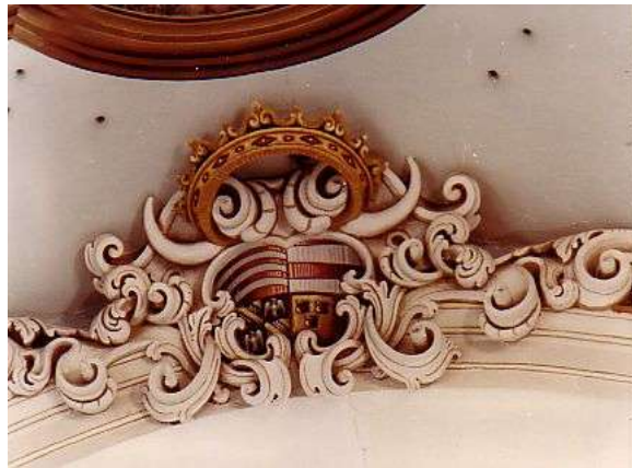
Stemma dell’arco trionfale dei Sanseverino - Fardella