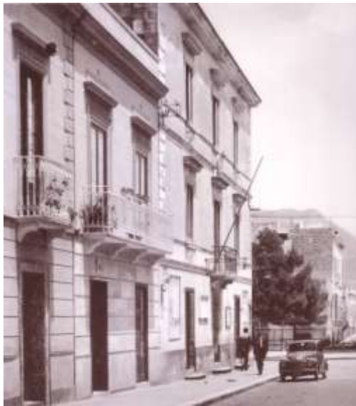
Palazzo Fardella noto come Palazzo Sanseverino sede del Comune fino agli anni 70