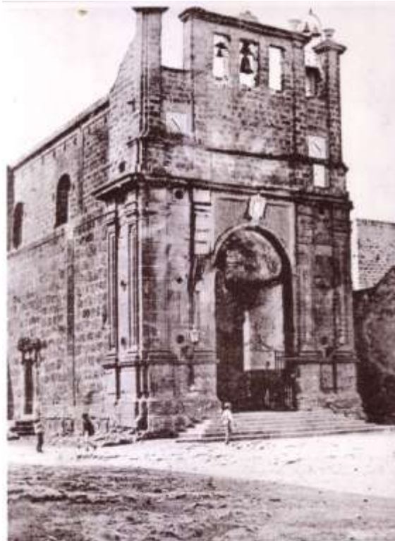
La Chiesa Madre da una foto del 1903

Queste date sono importantissime in quanto avvalorano l’ipotesi sopra descritta.