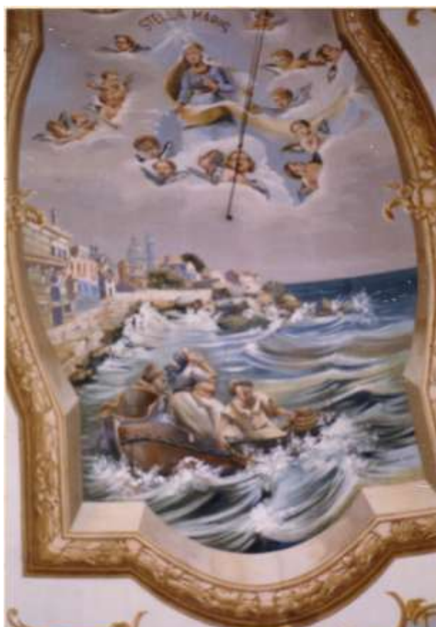
Chiesa di Portosalvo - Affresco della volta

A chi veniva dall'attuale via Amendola la piazza si doveva presentare diversa da come è attualmente: molto probabilmente dal lato Est, ripetendo lo stesso movimento del lato opposto, doveva essere più larga fino all'attuale Cortile Portosalvo senza la presenza delle case attualmente costruite; la pavimentazione sicuramente “giagata”. Al lato di tramontana, chiudendo l'angolo della piazza, di fronte alla chiesa, si ergeva con il suo torrione il Castello