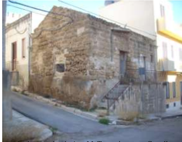
Antica casa in via Arc. M. Trapani - zona Castello

È, infatti, in questa zona, chiamata "u casteddu" che si vedono ancora piccolissime case semidirute di una o due stanze con i tetti spioventi a "ciaramiri anniati" poggiati su un intreccio di canne sostenute da una serie di listelli di legno perpendicolari sostenute da una semplice trave portante e con una sola piccola porta d'accesso che si apre in stradine molto strette. Non di rado sopra la porta d'ingresso si apre una finestrella da cui prendeva luce l'ambiente. Spesse volte, si ha notizia della presenza nel posto di un pozzo esterno comune a tutti. Sicuramente furono queste le abitazioni in cui dovettero abitare i primi manovali della "fabbrica" del nuovo borgo.