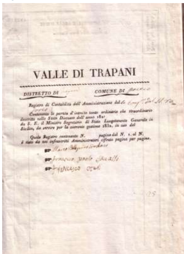
Prima pagina Registro di Contabilità

“Al già detto Reverendo Don Paolo Guarnotta soldo a lui spettante e censo dal dì primo Settembre a tutto or spirato Dicembre 1828 incluso il censo annuale della sagristia (ducati 4)”.