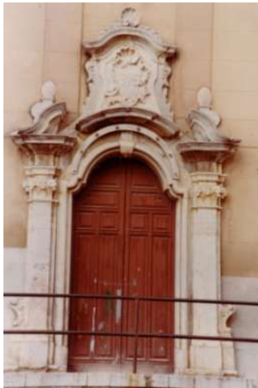
Chiesa del Rosario Paceco Il portale

In uno di quei pochi documenti esistenti, riguardanti gli anni 1825 – 1835 dell'attività amministrativo contabile della Compagnia "Opera Pia Maria SS.ma del Rosario" affidata fin al 1833, in conseguenza della soppressione dell'Istituzione, ad una Commissione Comunale Amministrativa, composta