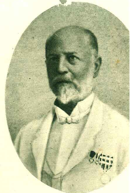
AGOSTINO BURGARELLA - FONDATORE DELLE SALINE DI ADEN

Con decisione risoluta e con evidente coraggio, malgrado egli avesse consumato quasi tutti i mezzi nei vani tentativi di Assab, il Burgarella rinunciò ipso facto al viaggio di ritorno ed espletò immediatamente le pratiche per ottenere dal Governo inglese la concessione del terreno; concessione, infatti, che gli venne subito accordata per un periodo di 99 anni; il che avvenne esattamente nell'anno 1883. Egli dunque, con quella fede e con quello spirito di intraprendenza che distingue la nostra nobile stirpe, si mise subito all'opera e gettò le basi di quelle che sono oggi tra le più grandi saline del mondo, dalle quali traggono mezzi di vita numerose maestranze trapanesi e che costituiscono lustro e decoro per gli eredi della nobile e tipica figura dell'industriale Burgarella: eredi che mantengono tuttora la fiorente industria in piena efficienza.