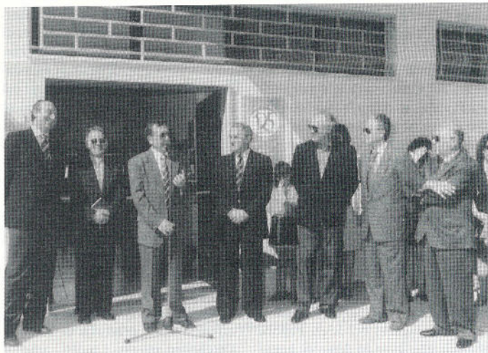
Il Presidente del CONI Castelli e le altre autorità nel corso della cerimonia inaugurale

Tutte le autorità presenti si sono impegnate affinché questa nuova realtà di Marsala sia tenuta nel giusto merito.