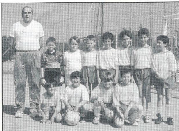
I "Pulcini" dell'Acestiana Erice

I giovanissimi, iscritti in un girone di ferro con Verde Nero "A", Venaria Reale Torino (entrambe vincitrici nelle ultime edizioni del torneo) e