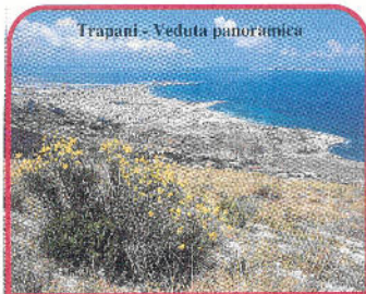
Trapani - Veduta panoramica