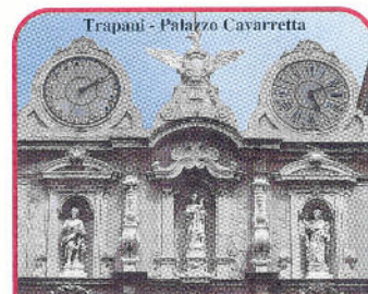
Trapani - Palazzo Cavarretta