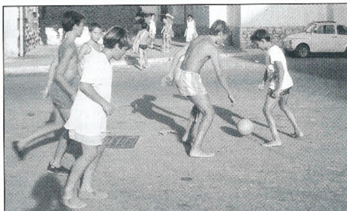
Scalzi per le strade. È un aspetto sociale che rischia di assumere contorni ancora più tragici se si abbandona al suo destino l'associazionismo sportivo

Il 28 Febbraio 2001 scadono i termini per presentare alla Provincia Regionale di Trapani la domanda di contributo per l'attività sportiva. Essendo cambiato il regolamento, è bene che le società interessate si informino sulle modalità da rispettare, al fine di evitare spiacevoli "tagli".