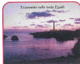
Tramonto sulle isole Egadi