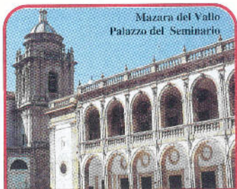
Mazara del Vallo Palazzo del Seminario