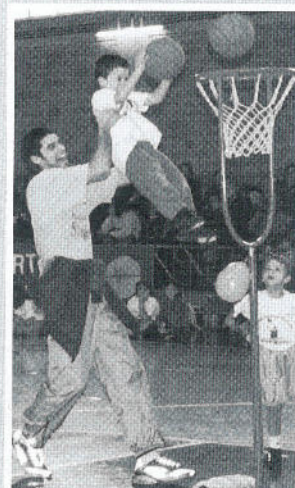
Il minibasket è una festa