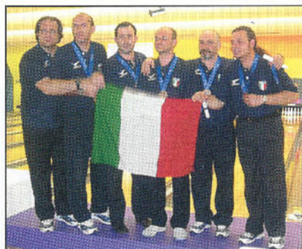
Squadra Olimpica terza classificata a Melbourne

Questi risultati rappresentano un ottimo auspicio per l'inizio dell'imminente stagione agonistica 2005 e per l'intero movimento del Bowling Provinciale che annovera moltissimi appassionati e tanti ottimi atleti.