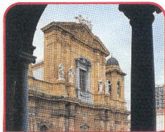
Marsala: il Duomo, XII-XVII secolo