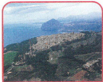
Erice: veduta aerea e sullo sfondo Monte Cofano