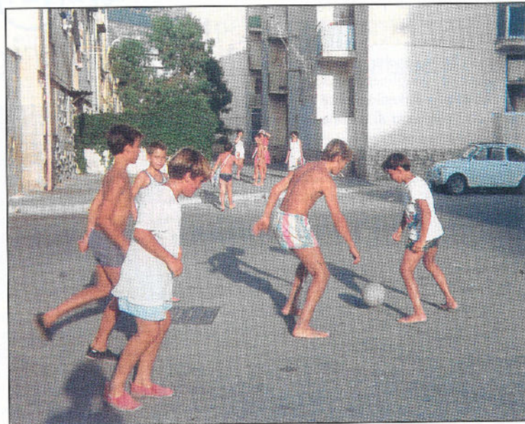
L’auspicio del Coni è che ogni quartiere sia dotato di adeguati impianti sportivi