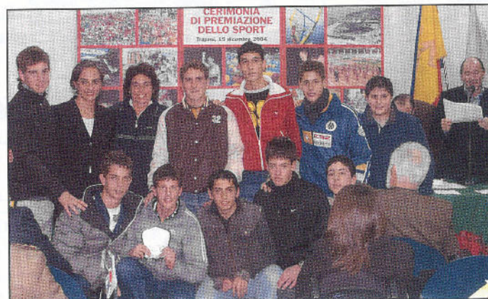
Gli studenti della "Livio Bassi", allenati dalla Prof.ssa Canzonieri, terzi classificati ai Camp. Italiani di Rugby under 14, dei Giochi Sportivi Studenteschi