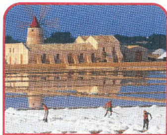
Marsala: Riserva Naturale dello Stagnone, salina infersa