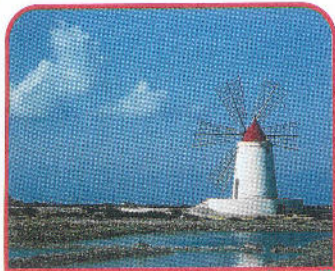
← Paceco - Mulino a vento