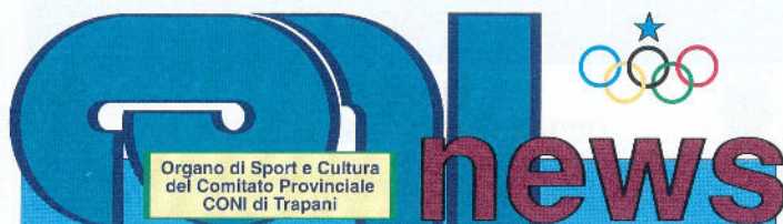
Organismo di Sport e Cultura del Comitato Provinciale CONI di Trapani