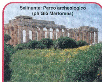
Selinunte: Parco archeologico

"Poste Italiane SpA - Spedizione in abbonamento postale - DL 353/2003 (conv. in L. 27/02/2004 n°46) art.1, comma 2, DCB TRAPANI"