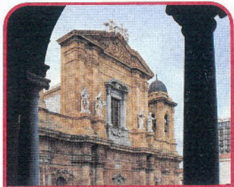
Marsala: il Duomo, XII-XVII secolo