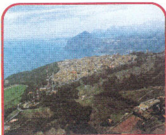
Erice: veduta aerea e sullo sfondo Monte Cofano