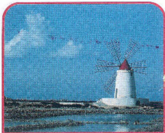
← Paceco - Mulino a vento