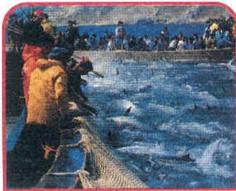
← Isole Egadi: Favignana, la tradizionale pesca del tonno