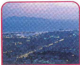
Trapani: veduta panoramica con le Isole Egadi