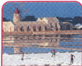
◀ Marsala: Riserva Naturale dello Stagnone, salina infersa - (ph Alfio Garozzo)