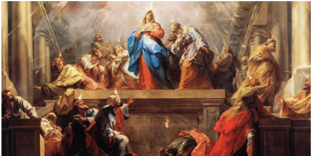
La Pentecoste di Jean II Restout (1732)

Il nome di Pentecoste viene da pentēkostē , che significa cinquantesimo (giorno). È, infatti, il cinquantesimo giorno dopo la Pasqua. Pentecoste è il compimento della Pasqua. Erano due feste legate al ciclo della natura: Pasqua era la festa di primavera, Pentecoste l'inizio della raccolta del grano. Le due feste sono state interpretate attraverso gli avvenimenti della storia della salvezza. Per gli ebrei, Pasqua è diventata il ricordo dell'uscita dall'Egitto, Pentecoste il ricordo della consegna dei comandamenti sul Sinai. Per noi cristiani, Pasqua è la festa della risurrezione di Gesù e Pentecoste la festa dell'effusione del suo Spirito. Bisogna tuttavia ricordare che la Pentecoste cristiana non è la festa dello Spirito Santo, inteso come Persona divina in se stessa, ma è celebrazione di un avvenimento di salvezza, cioè di uno di quegli interventi di Dio che nella realizzazione del piano salvifico decidono in modo unico e definitivo delle sorti dell'uomo e del mondo. Questo evento consiste soprattutto nel dono dello Spirito Santo. La Parola di Dio ci dà della Pentecoste la dimensione di evento divino avvenuto nella storia attraverso i segni del vento impetuoso, del