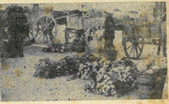
Verdure e frutta tra il fango e l'immondizia (Fotobionte)