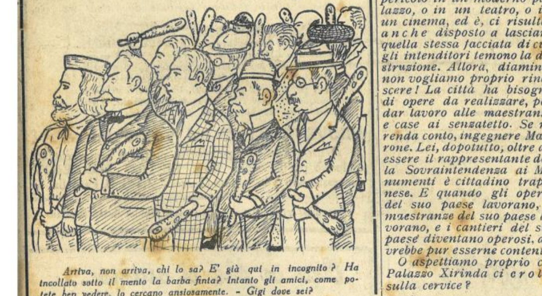
Arriva, non arriva, chi lo sa? E' già qui in incognito? Ha incollato sotto il mento la barba finta?