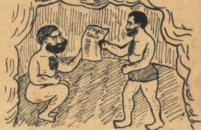
— Io sono Ercole; e tu chi sei? — Io Caco. — E allora eccoti una copia del Sagittario.