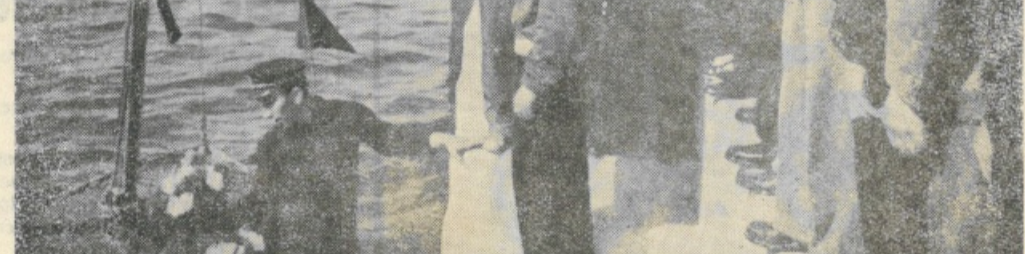
Gli Argonauti sbarcano a Trapani

Quando nell'azzurra distesa del l'onda le torri di Trapani, ultime scote avanzate della Patria nel mare latino, si perdevano oltre il confine dell'orizzonte, e i due atomi di De Gasperi pulsavano tra cielo e mare, ricordando gli otto ardenti ragazzi che essi non sono soli. Li segue, insieme col palpo del mare, insieme col palpito del cielo, l'anima grande e luminosa e veramente immortale della grande Madre: la Patria.