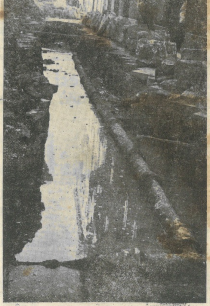
Ecco un aspetto dei lavori di riparazione e sostituzione delle tubature idriche opportunamente disposti ed eseguiti in Via Antonino Turretta (già S. Rocco) ed in Via Cortina. Attraverso questi tubi marci e corrosi passo spesso l'acqua che noi beviamo...