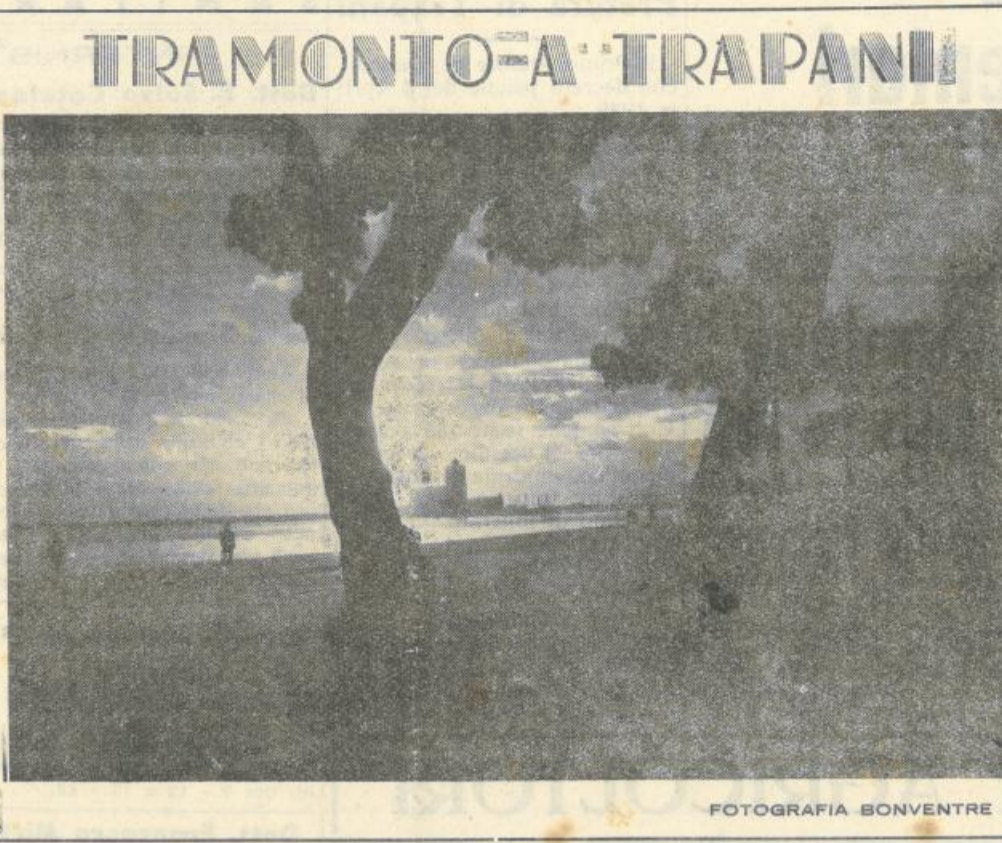
TRAMONTO A TRAPANI

dei cittadini. Noi vorremmo insomma che a reggere le sorti del Comune andassero galantuomini intelligenti, volitivi, fattivi, capaci, disinteressati, unicamente pensosi del pubblico bene; e che avessero una tessera ed un distintivo, e di che specie, ci importerebbe in modo assai relativo. Questo è il nostro proposito, questo è il nostro sogno; e per esso, se anche a qualcuno dispiaccia, ci batteremo con tutte le nostre forze.