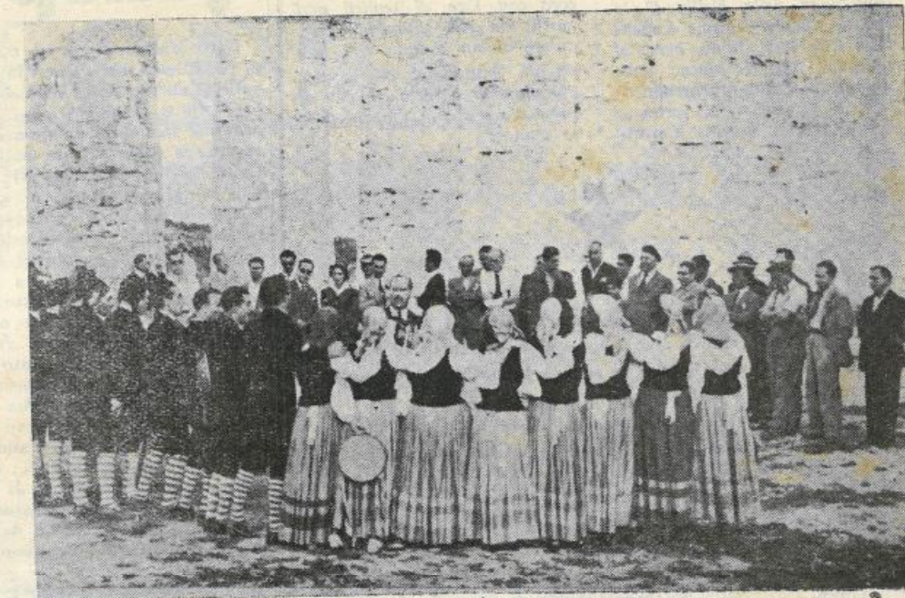
A Segesta il Coro delle Egadi canta alcune canzoni della nostra terra.