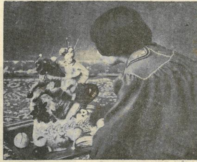
In questa fotografia Rosario Bonventre ha mirabilmente ritratto la gioia di una nostra bimba dinanzi alla "pupa di zuccaru", e alle "cosi di marturana".