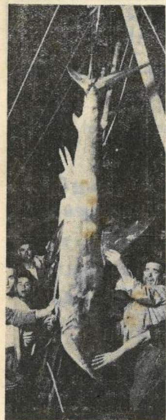
Il pescecane catturato domenica scorsa nelle nostre acque

come aveva promesso; poiché la linea tranviaria rappresenta un serio pericolo per la incolumità e la salute pubblica, si ponga la società palermitana in questa alternativa: o assumere nuovi impegni, o levarsi dai piedi.