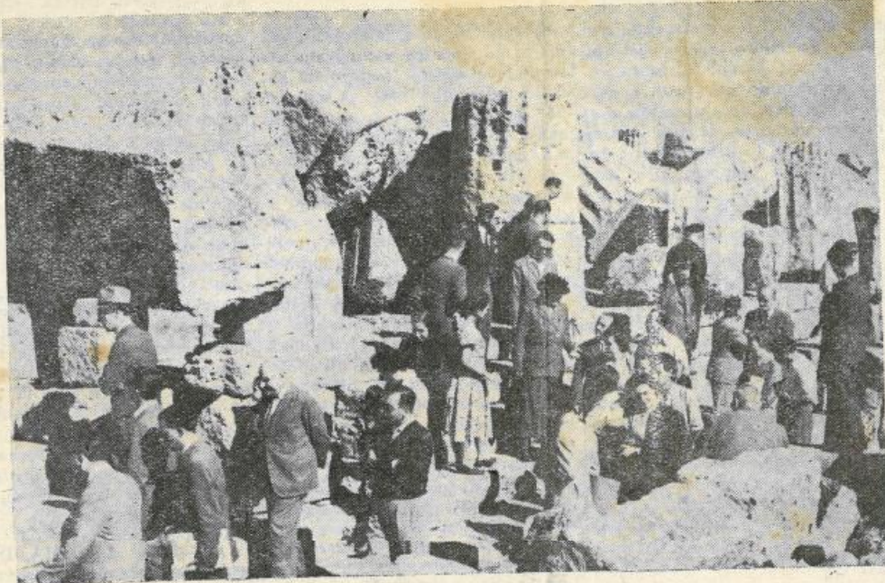
La visita alle rovine di Selinunte.