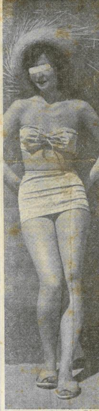
Bonventre ci ha fornito questa magnifica fotografia realizzata nel suo studio; l'ineccepibile proprietaria ci ha permesso di pubblicarla. Solo condizione mascherina agli occhi.

più grandi profeti e realizzatori del Paradiso comunista. Come si vede, dalla padella si casca nella brace. Non vogliamo, infine, passar sotto silenzio una notizia che forse sarà sfuggita ai distratti, ma che merita di esser posta in un certo rilievo: quella che riguarda l'azione civile di risarcimento dei danni promossa da alcuni congiunti delle vittime dell'attentato di Via Rasella contro gli autori e gli organizzatori dell'attentato stesso.