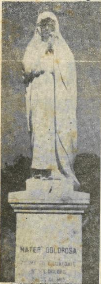
L'espressiva statua dell'Addolorata, eretta recentemente nel Cimitero di Trapani.

Fra pochi giorni torneremo, in mesto pietoso pellegrinaggio, nel Cimitero che racchiude le spoglie mortali dei nostri cari estinti, là dove essi, per quella divina corrispondenza di amorosi sensi, che nasce dall'illusione o, meglio ancora, dalla fede, ci appaiono vivi e presenti come non mai, stretti a noi da un amore indissolubile che, purificato dalle scorie terrene, si è fatto più alto e nobile e sacro.