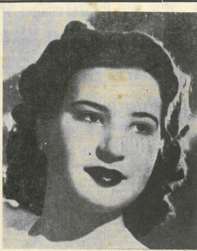
Ecco la bellissima Narriman Sadek, di sedici anni, già fidanzata di un funzionario egiziano, che Re Faruk, sovrano democratico e di buon gusto, ha scelto come sua moglie, suscitando a Corte un vero cataclisma protocollare. A destra, Re Faruk, mentre si reca a Corte nel suo favoloso cocchio tappezzato di damaschi preziosissimi e tempestato di pietre preziose.

Oggi — dopo tanti anni — dopo le guerre, acquistate le butere e le cattiverie degli uomini — i cittadini s'inclinano innanzi al Suo busto. Raccogliamo i giovani, dalla memoria di Lui, sprone per amare — come Egli amò — gli studi e la Sua Trapani: binomio inscindibile della Sua esistenza.