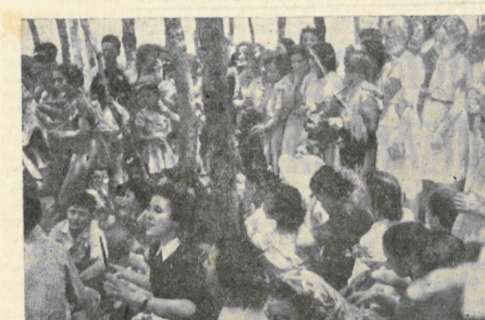
Selinunte: Gli alunni nella pineta