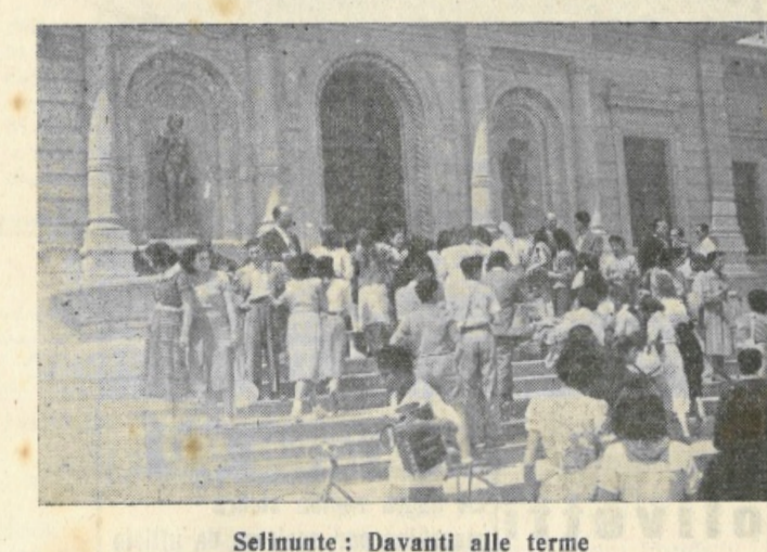
Selinunte: Davanti alle terme

Ha avuto luogo sabato scorso una simpaticissima gita che ha portato professori ed alunni dell'Istituto Magistrale "Dante Alighieri" nella ridente città di Sciacca, rinomata per le sue Terme già oltre 25 secoli fa apprezzate e valorizzate dagli antichi abitanti di Selinunte.