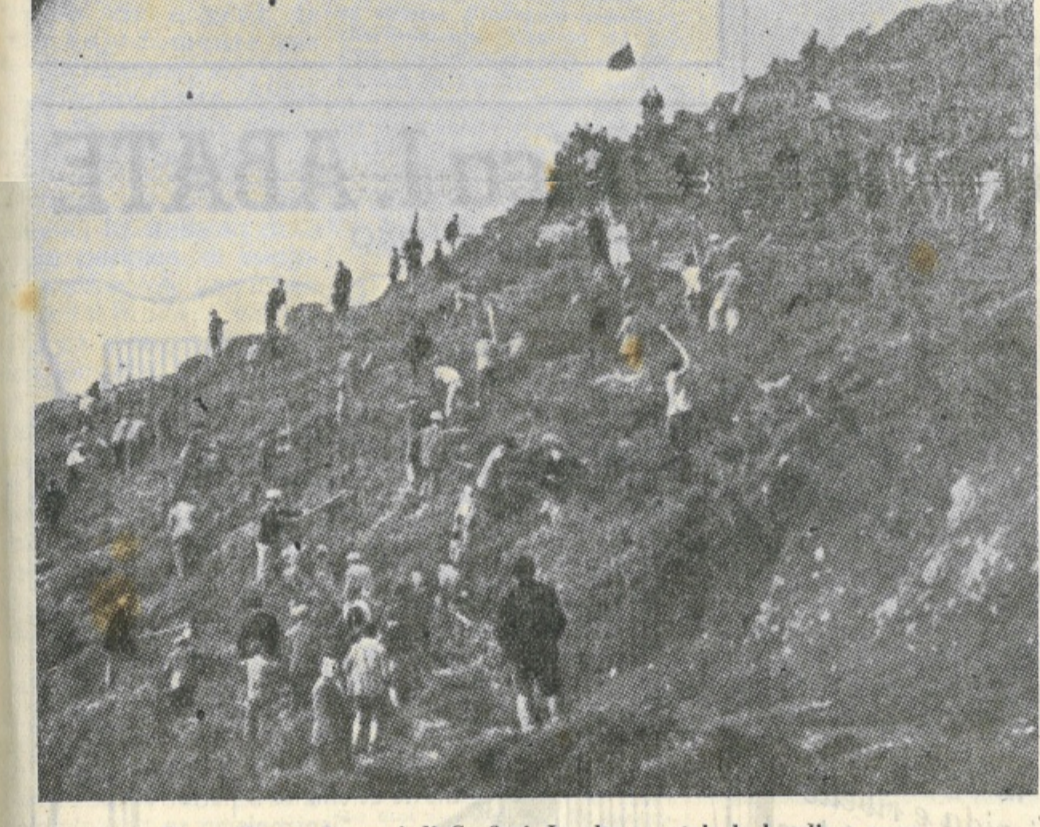
Una collina nei pressi di Carfizzi. In alto sventola la bandiera rossa