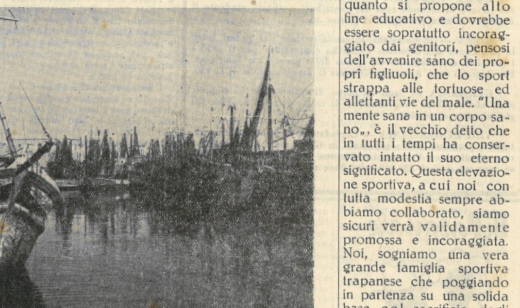
I motopesca mazaresi avranno tutti il Radar entro l'anno

cominciò a spiegare, e qui gli cediamo la parola: "Il Radio Scandaglio grafico Bendix utilizza una emissione superonica diretta dallo scafo verso il fondo del mare. Quest'onda nel suo cammino va a colpire il fondo, penetrando più o meno a seconda della sua consistenza, e gli ostacoli (pesci, relitti semiosmersi, mine) che si trovano fra l'emittente ed il fondo. Le onde superoniche, dopo l'urto, ritornano allo strumento che, elettronicamente, ne misura l'intervallo che viene riprodotto su una scala grafica in movimento con la nave e proporzionalmente alla sua velocità; così, in ogni istante, si ha una rappresentazione grafica di quanto esiste tra il natante ed il fondo del mare, una rappresentazione grafica dello stesso fondo e degli ostacoli che sono su di esso.