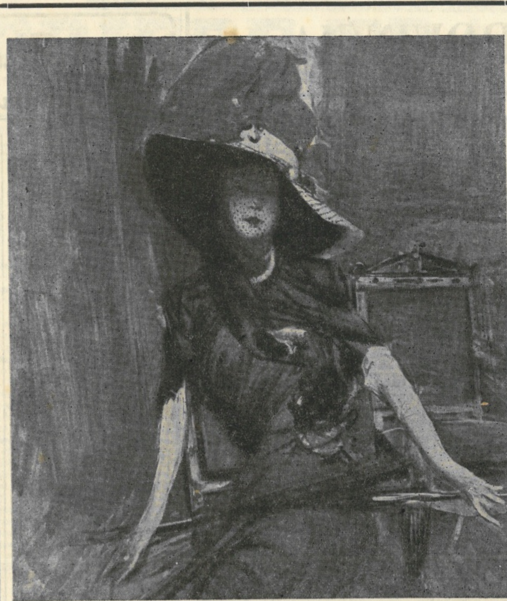
La bella "Dama in blu", del Boldini guarda enigmatica dietro la veletta