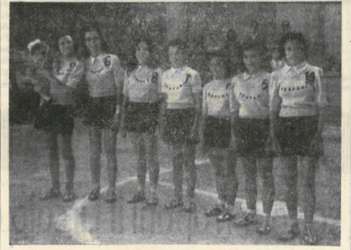
Le atlete trapanesi prima dell'incontro