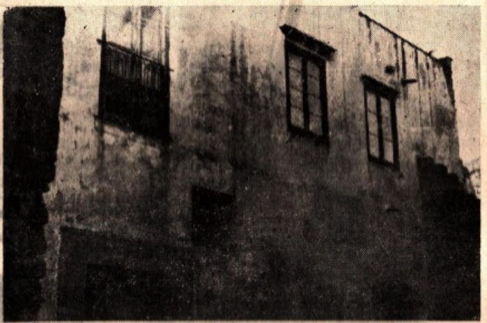
La casa di Via Mannone N. 54, vista dal cortile nel quale Giuliano fu trovato morto la mattina del 5 luglio.

a trovarsi, senza volerlo, implicato in una faccenda pericolosa che gli darà notevoli guai. E ci sembra proprio di vederlo, quest'uomo onesto che è costretto a vivere in ansia per la paura che qualcuno possa scoprire la presenza a casa sua dell'ospite indesiderato e indesiderabile. Da quel momento Gregorio De Maria ha altre preoccupazioni: il suo ospite, indubbiamente di riguardo, ha