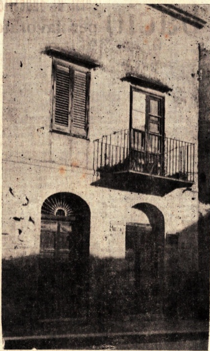
La casa di Via Mannone, 54 - Dietro le persiane accostate non occhieggia più l'ospite indesiderato - Solo un silenzio gravido d'attesa regna nella casa.