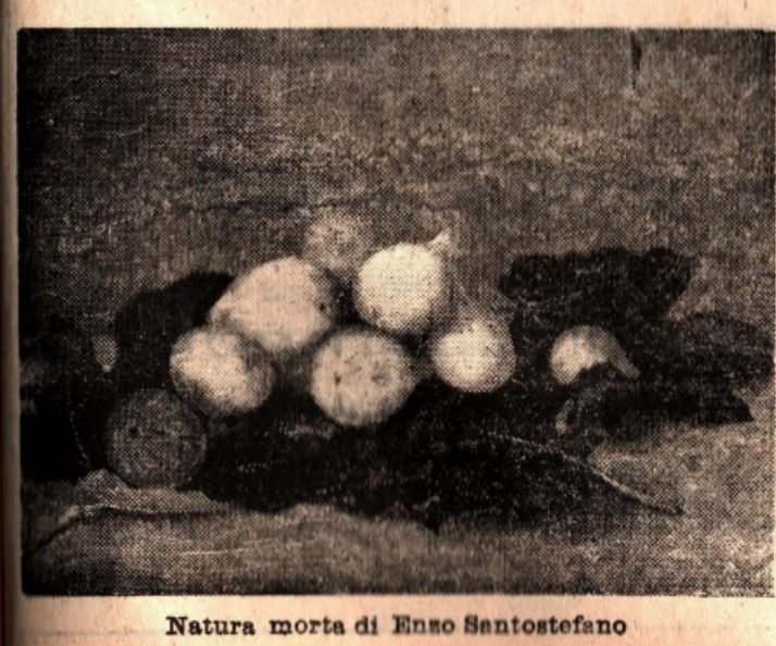
Natura morta di Enzo Santostefano