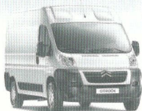
Nuovo Jumper da 13.600 euro

Fino a 8.000 euro di ecoincentivi sui veicoli commerciali Citroën.