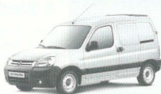
Berlingo Van da 5.950 euro

Tra gli equipaggiamenti disponibili: ABS, ESP+ASR, 6 airbag, telecamera posteriore, sensori di parcheggio posteriori, sospensione posteriore a compensazione pneumatica, climatizzatore, bluetooth.