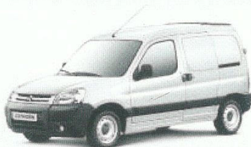
Berlingo Van da 5.950 euro

Tra gli equipaggiamenti disponibili: ABS, ESP+ASR, 6 airbag, telecamera posteriore, sensori di parcheggio posteriori, sospensione posteriore a compensazione pneumatica, climatizzatore, bluetooth.