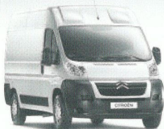
Nuovo Jumper da 13.600 euro

Fino a 8.000 euro di ecoincentivi sui veicoli commerciali Citroën.