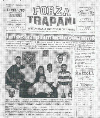
Il numero dei 10 anni: Settembre 1998

Da qui la nostra disponibilità al confronto, al dialogo, anche all'autocritica, in certe occasioni, sia con i tifosi sia con le società sportive, oggetto della nostra attenzione, ritenendo che non l'indifferenza ma l'interesse delle persone fosse la spia del loro attaccamento verso quelle stesse società sportive. E questo sentimento si nutre appunto della voglia dei tifosi di conoscere e partecipare delle vicende della loro squadra, della voglia di dire la propria e di dibattere sulle questioni più importanti.