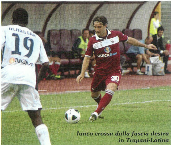
Lunco crossa dalla fascia destra in Trapani-Latina

Come al solito, le disquisizioni relative all'undici da mandare in