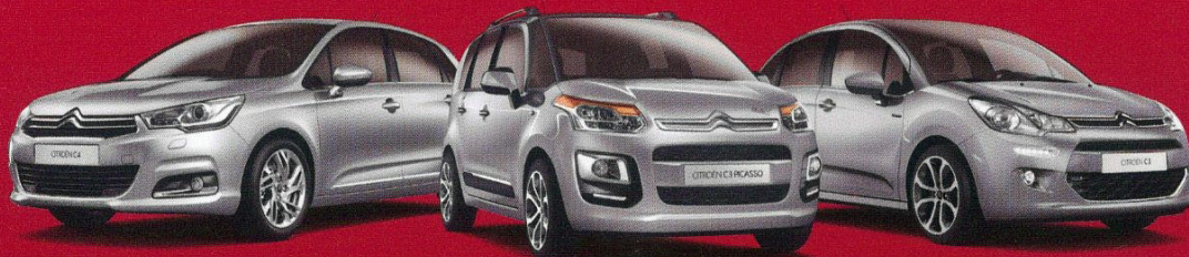
CITROËN C3 PICASSO