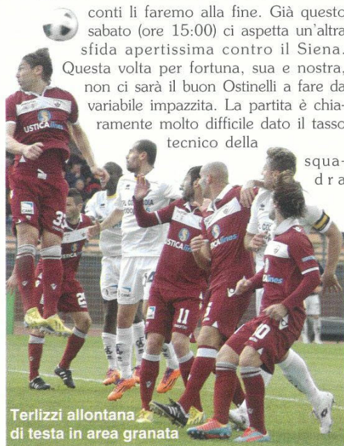
Terlizzi allontana di testa in area granata

Come è giusto che sia gli esami non finiscono mai e i