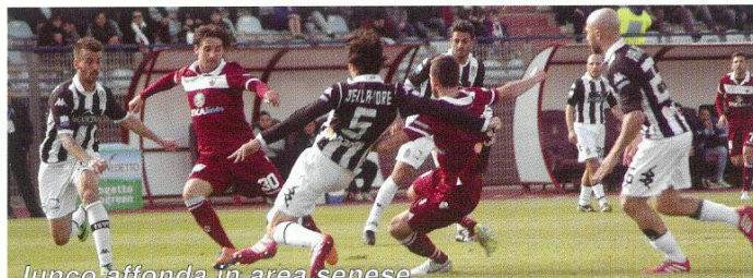
Junco affonda in area senese

Inoltre il Varese nell'ultimo turno ha perso in casa, mentre i granata hanno vinto in trasferta: speriamo non ci sia alcun contrappasso, come invece è accaduto al Latina dopo la vittoria esterna di Brescia, immediatamente "compensata" dalla sconfitta interna con il Trapani. In realtà, aldilà della scaramanzia, il Varese sarà un brutto cliente. Lo danno come una squadra in crisi di gioco e d'identità, ultimamente molle e svagata. Ma i biancorossi sono "disperati", ossia a caccia d'un pronto riscatto.