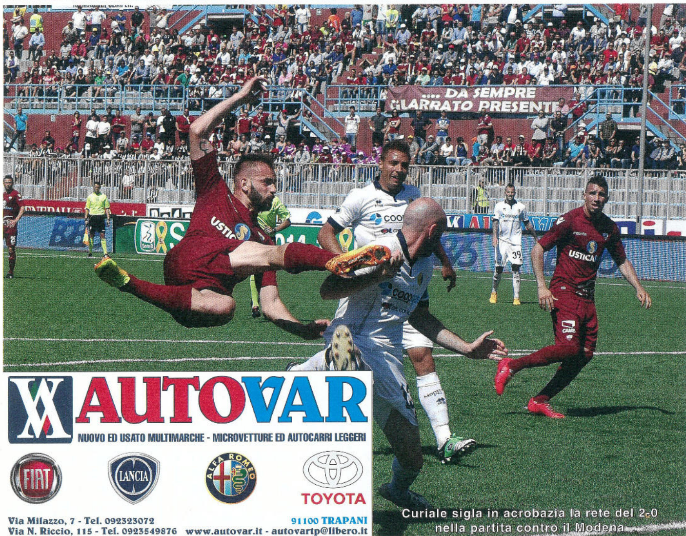
Curiale sigla in acrobazia la rete del 2-0 nella partita contro il Modena.