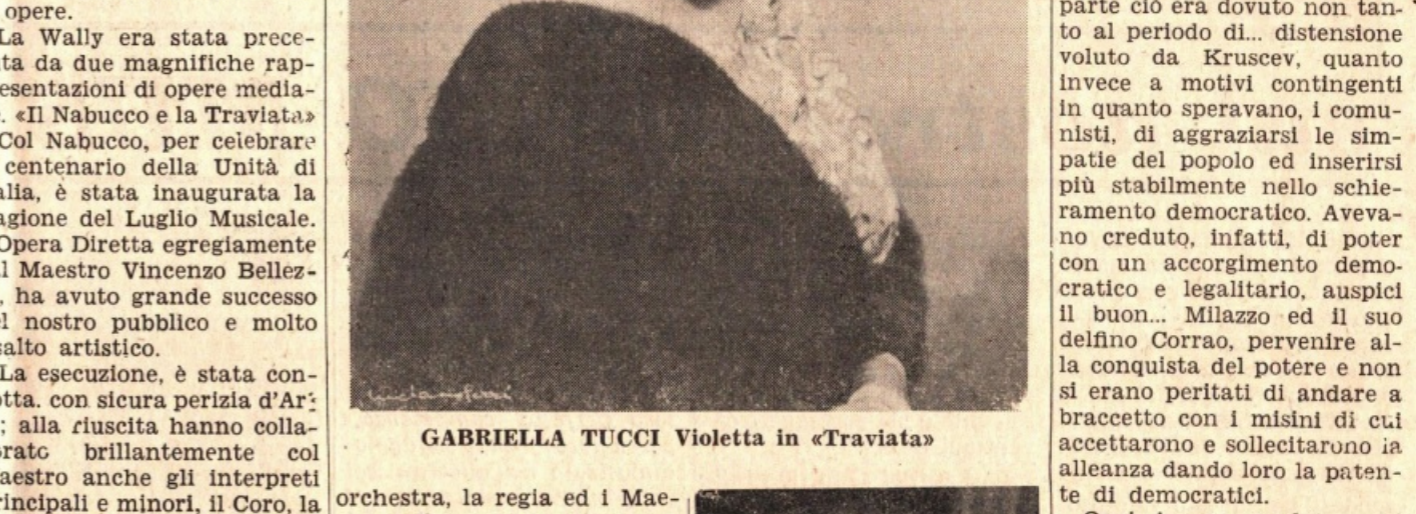
GABRIELLA TUCCI Violetta in «Traviata»

Il comunicato che il P.C.I. ha diramato è molto evidente e si commenta da sé: bisogna seguire l'esempio del Giappone. Si passa - scrivemmo - a fare conoscere all'opinione pubblica italiana le esperienze di lotta, i successi, gli obiettivi delle masse popolari, a dare concreto impulso a tutta l'azione per un nuovo corso della politica estera italiana, per l'eliminazione delle basi straniere dal nostro territorio...».