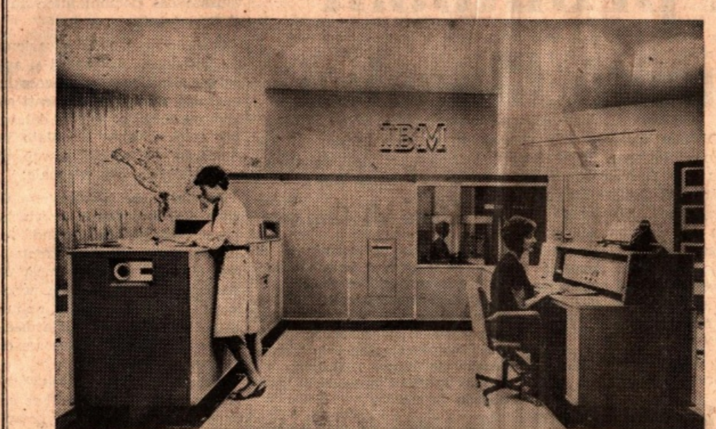
La calcolatrice elettronica IBM-305 «Ramac», è un modello simile a quello che fu impiegato con successo alle Olimpiadi della Neve di Squaw Valley nel 1960 e per la tabulazione dei voti durante le ultime elezioni presidenziali negli Stati Uniti.