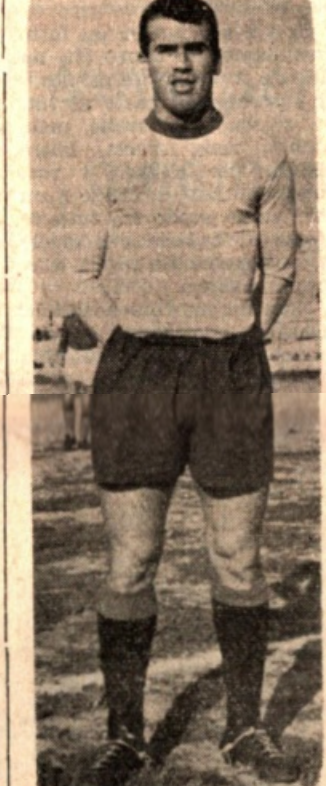
Minto forse al Pescara

Per il centro avanti della cui di recente quello non aveva parlato per un eventuale cessione al Marsala le trattative sembrano andate a vuoto. Ma il sodalizio non pensiamo che costagli acquirenti meno di 5 milioni.