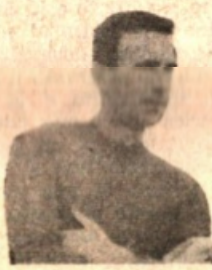
Orzan se ne va