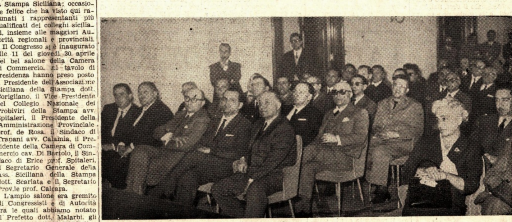
Autorità e Giornalisti presenziano alla inaugurazione