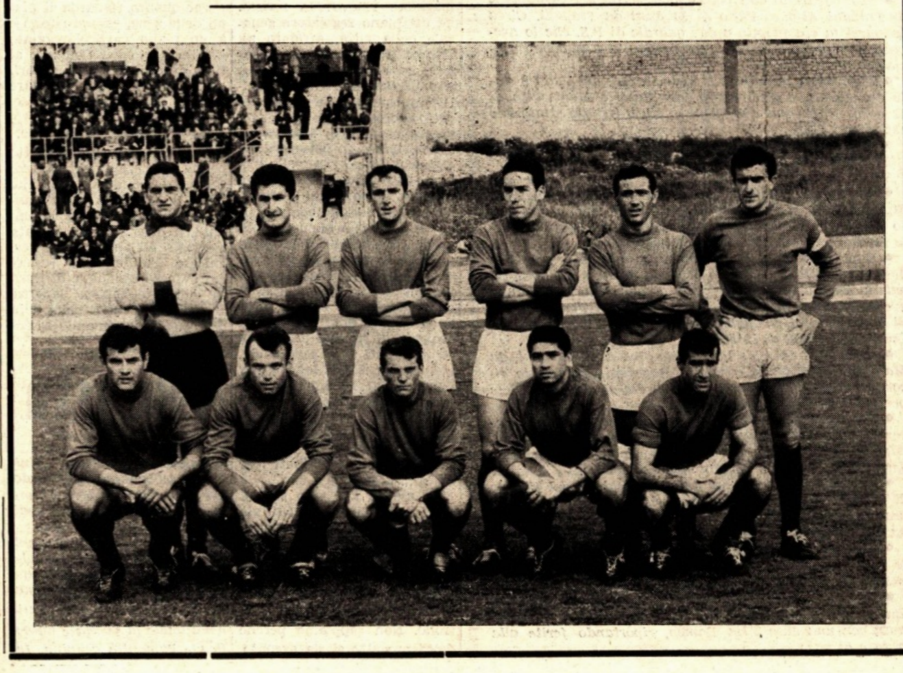
Il Trapani è virtualmente salvo