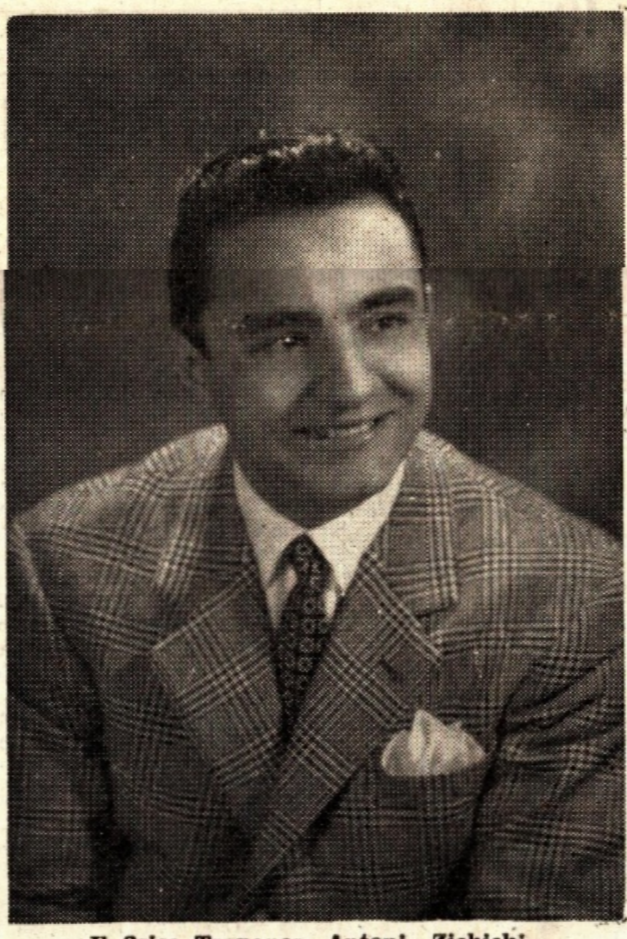
Il fisico Trapanese Antonio Zichichi

GINEVRA - Il professor Weisskopf, direttore generale del Centro europeo di ricerche nucleari di Ginevra, ha annunciato in una seduta del consiglio di questa organizzazione la scoperta dell'antideutone.