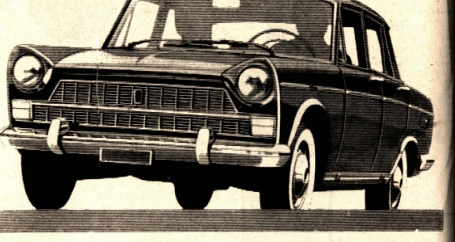
Prezzo L. 1.360.000