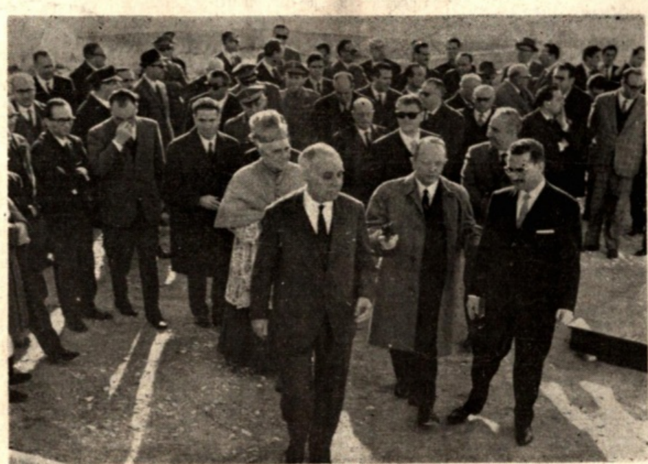
Il Ministro Mattarella, il prof. Pescatore e le autorità alla inaugurazione del depuratore delle acque del Pozzo della Madonna

Il Sindaco di Trapani prof. Calcarà ha preso per primo la parola puntualizzando la gravità della situazione idrica della città, situazione che va peggiorando di giorno in giorno anche per la mancata