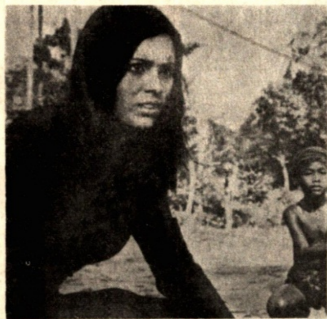
L'attrice australiana Daliah Levi in una scena del film, dove ricopre il ruolo della ragazza malese innamorata di Lord Jim

sua impegnativa impresa e, considerato un eroe, un liberatore, si stabilisce per sempre in quel meraviglioso angolo sperduto assieme ad una donna malese, che gli è stata affianco nei momenti pericolosi.