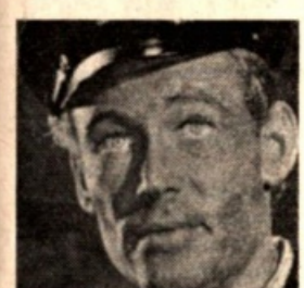
L'attore Peter O'Toole

L'avvenimento cinematografico più importante dell'anno — della cinematografia inglese — è costituito dalla presentazione del film in prima mondiale al Teatro Odeon in Lancaster Square di Londra, in occasione dell'edizione — quest'anno giunta alla ventesima — della «Royal Film Performance» a beneficio del «Cinema Benevolent Funds». Quando nel febbraio scorso, il film del regista Richard Brooks, «Lord Jim», venne presentato al teatro Odeon di Londra, alla presenza di S. M. la Regina Madre Elisabetta e della Principessa Margaret, raccolse — alla fine della proiezione — i più calorosi e scroscianti applausi, mai fino ad allora riservati ad un film.