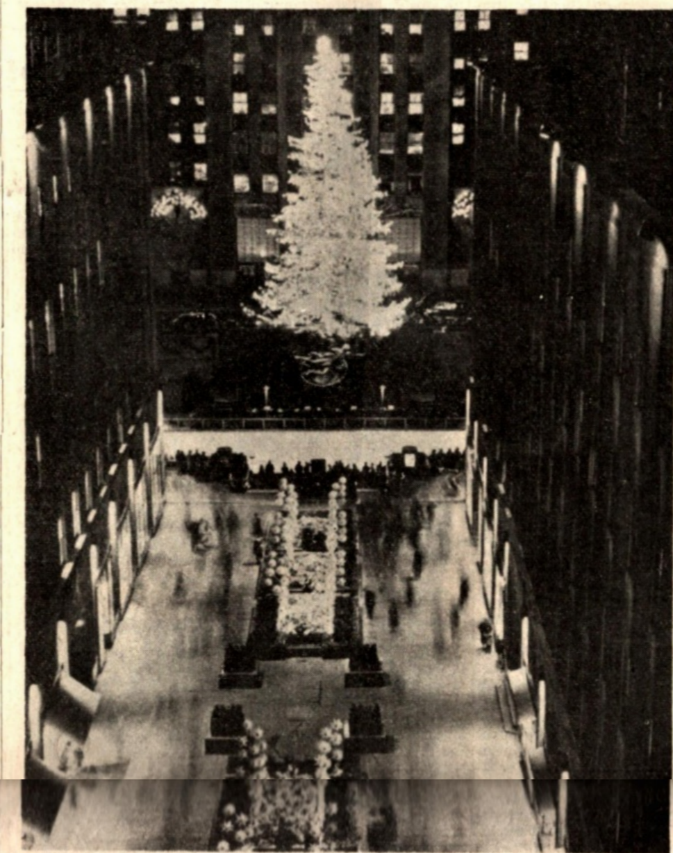
In Arkansas, nel Parco Nazionale di Hot Springs, si svolge sin dal 1931 un festival natalizio all'aperto, sotto gli auspici dell'Ente Forestale e della Camera di Commercio di Hot Springs: la sera della vigilia di Natale cori biancovestiti scendono lungo il sentiero

sto del tradizionale pranzo a base di tacchino, si usano i pranzi tipici etnici. A Palmer Lake, nel Colorado, è nata nel 1934 la tradizione di un «Christmas Party» al municipio: i cittadini vengono chiamati a raccolta per questa festa da uno speciale segnale di tromba. Le facoltà di musica dell'Eastern Kentucky State College a Richmond e del Berea College a Berea offrono concerti gratuiti due settimane prima di Natale, un anno a Richmond, un anno a Berea: sono concerti sinfonici, per lo più di musica sacra, con la partecipazione di un coro di 200 elementi.