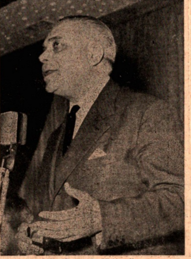
L'On. Bernardo Mattarella