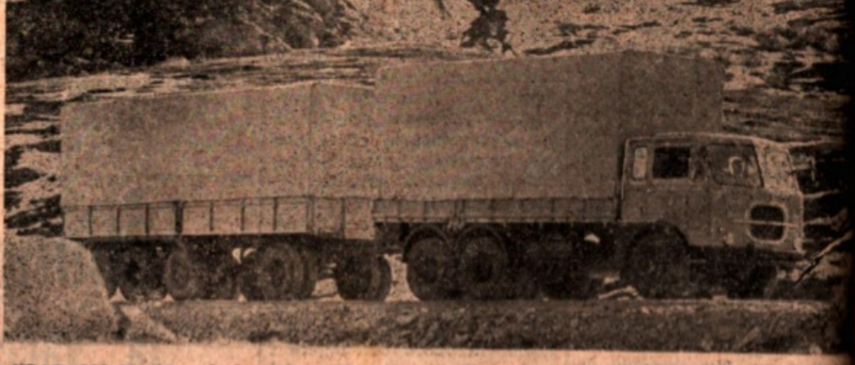
FIAT 693 N: nuovissimo modello con particolari doti di aderenza per la marcia su fondi stradali anche viscosi e ghiacciati. La caratteristica dei due assi motori lo rende specialmente adatto per impieghi gravosi (cantiere, lavori a dillo). Può essere carrozzato come veicolo speciale: ribaltabile, betoniera, trattore sportivo cemento sfuso, autocisterna ecc.