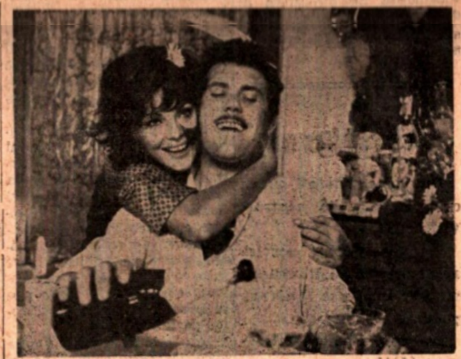
Vivina Lisi e Gastone Moschin in una scena del film