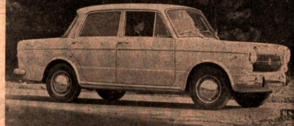
FIAT 1100 R: un modello di grandi attrattive, stabile, confortevole, vivace, spazioso, dai costi limitatissimi.

Al Salone di Ginevra la Fiat è presente in tutti i tre settori — automobili, veicoli industriali, trattori — di questa importante mostra. Sullo stand autoveicoli, la vasta gamma Fiat al completo con la 1100 rinnovata: 1100 R, recentemente presentata in Italia. Novità assoluta a Ginevra è la versione 1100 R familiare. Lo stand veicoli industriali illustra i più significativi modelli in ogni classe di trasporto per cose e persone, e per ogni specializzazione d'impiego; modelli che sono apprezzati per la loro economia ed il loro rendimento anche su molti mercati esteri. Sullo stand trattori vengono presentati i vari tipi « industriali » per movimento di terra e per cantiere, con 5 novità assolute tra gli apripista a cingoli, e caricatori a ruote e a cingoli di grande potenza.