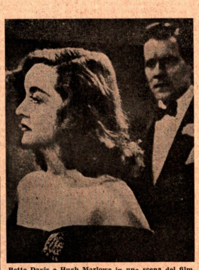
Bette Davis e Hugh Marlowe in una scena del film «Eva contro Eva» del 1950