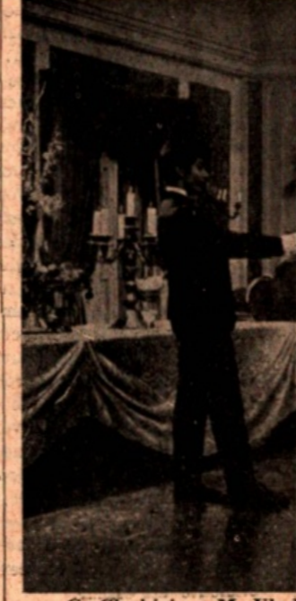
G. Chakiris e M. Viady in una scena del film