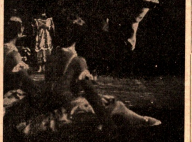
John Gilpin del Britain's Festival Ballet nel finale del secondo atto dello «Schiaccianoci» di Ciaikovsky.

dimostrare che un genere sia molto più popolare dell'altro. Un indice approssimativo ci è dato dal fatto che — almeno da qualche anno — i pubblici giovani preferiscono balletti