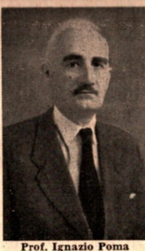
Prof. Ignazio Poma

Nel IX concorso internazionale di prosa e poesia latina, indetto dalla rivista «Latinitas» sotto gli auspici della Santa Sede, l'illustre concittadino e nostro apprezzato collaboratore prof. Ignazio Poma ha avuto assegnato l'onorevole «menzione» per la prosa.