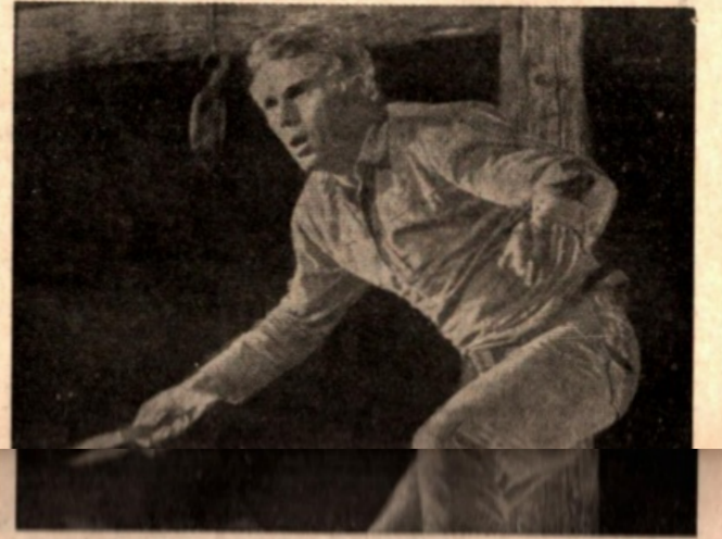
Steve Mc Queen in «Nevada Smith»