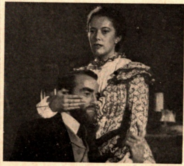
Monty Clift e Susan Khoner in «Freud»