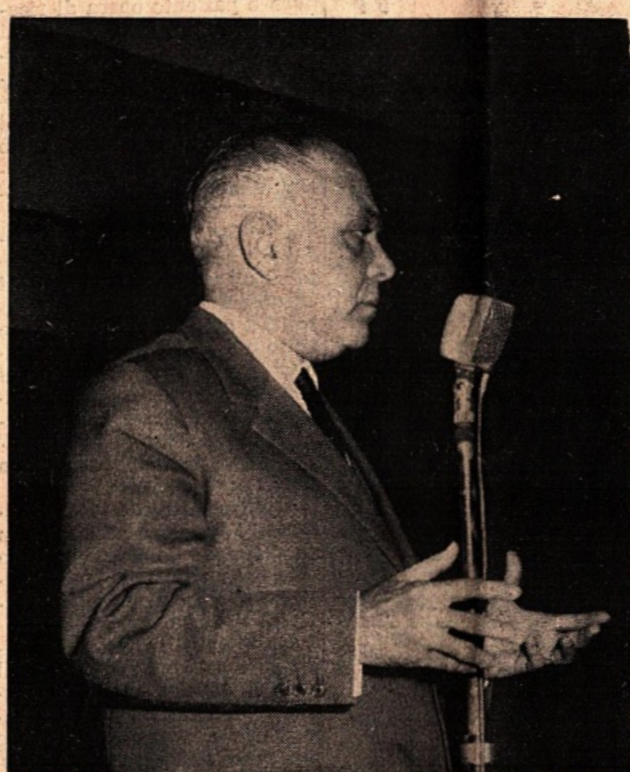
L'On. Bernardo Mattarella

Né tale realtà può essere ignorata dai partiti i quali talora dimenticano i motivi ed i temi fondamentali della lotta politica per dividersi in fazioni impegnate solo nella conquista delle preferenze. Ed in questa atmosfera capita magari