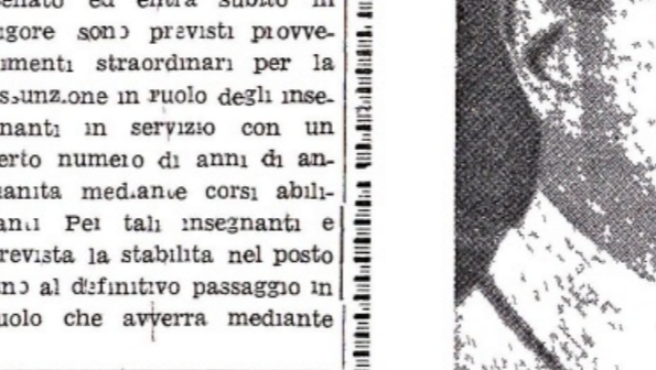
A Ginevra la città di Calvino Paolo VI "Pellegrino della pace" è stato accolto con una manifestazione trionfale senza precedenti, veramente insperata fino alla vigilia, quando erano affiorati contrasti e riserve.

La occasione di questo nuovo viaggio di Paolo VI è stata offerta dal Cinquantennale della Organizzazione Internazionale del Lavoro che ha sede proprio a Ginevra ed è stata una buona occasione per un incontro di fratellanza con i rappresentanti del Consiglio Economico delle Chiese cristiane.