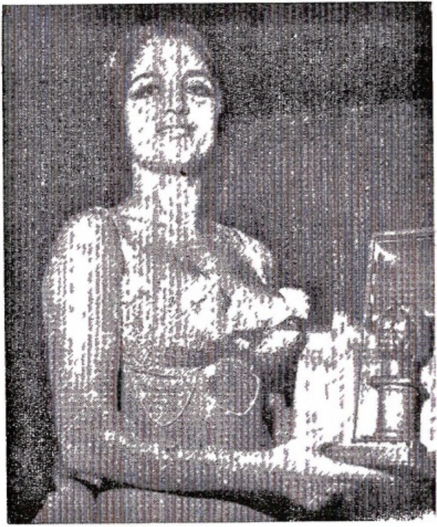
Elena di Romania «Venere d'oro 1969»

Una interessante tavola rotonda sull'erotismo ed un imponente concorso di spettatori hanno caratterizzato la manifestazione