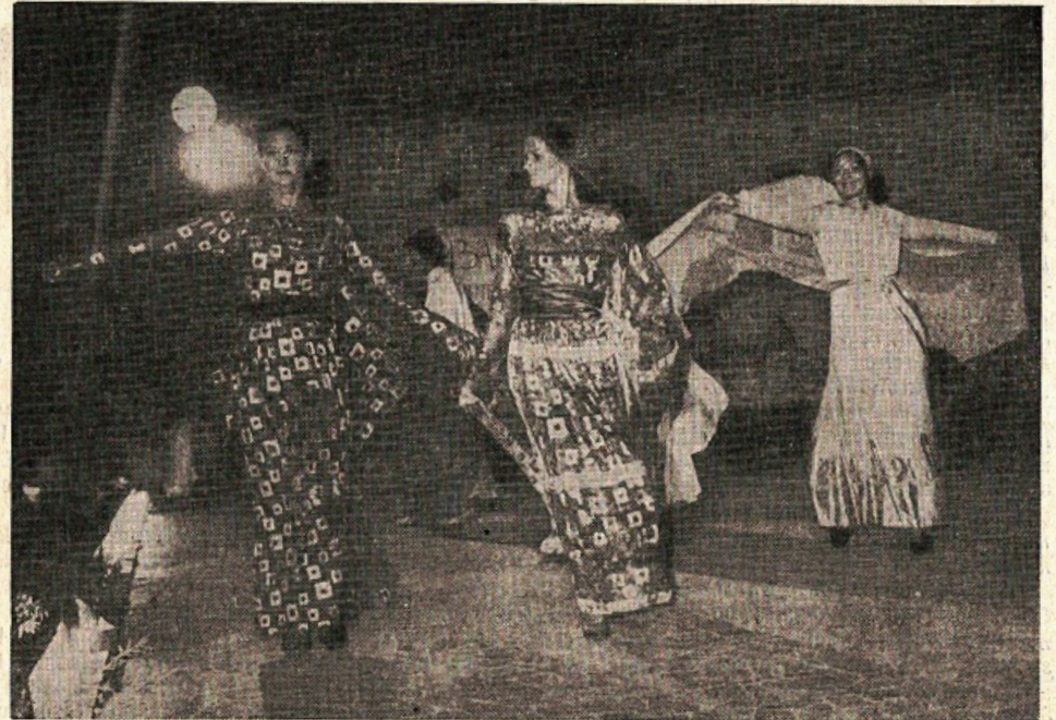
Un momento della sfilata di moda Balestra