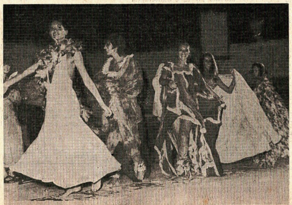
La moda Carnaby Street in passerella