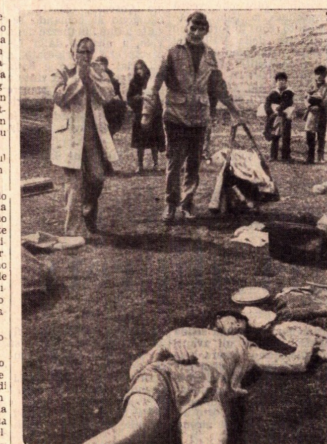
Jean Wallace e Nigel Davenport in una drammatica inquadratura del film «2000 la fine dell'uomo» diretto da Cornel Wilde.

Infatti: Ma a me interessa questa famiglia quello che accade loro durante la fuga verso la salvezza, un messo che al dramma, ha realizzato il film con la tecnica del documentario con il maggior realismo possibile con l'intento di mostrare che tutto ciò potrebbe verificarsi con facilità se si continua su questa strada.