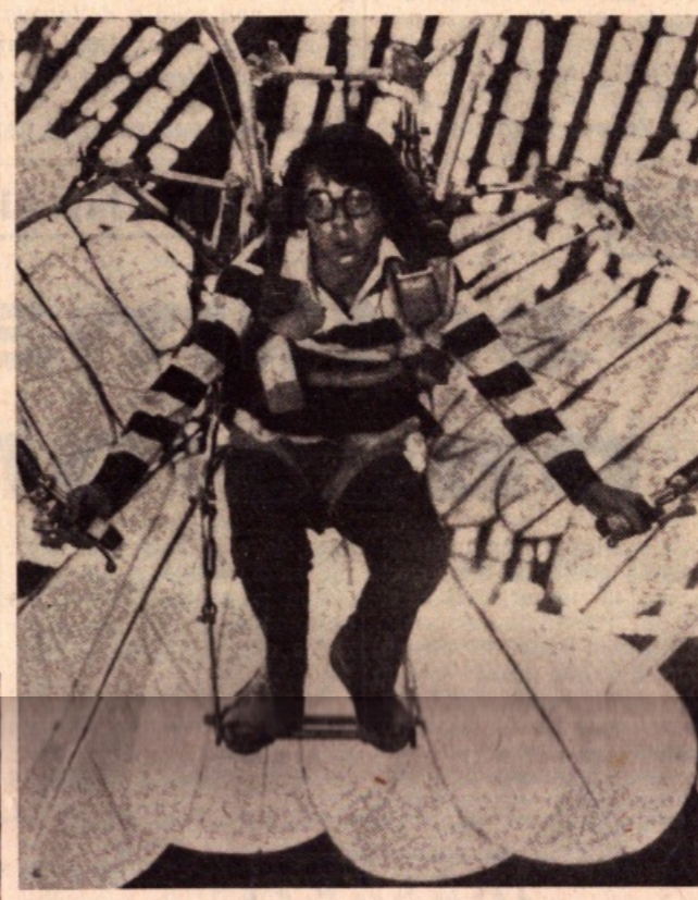
Bud Curt in una delle più illuminanti inquadrature del film «Anche gli uccelli uccidono» che sta ottenendo un grande successo in America. Si tratta di una feroce satira sul mondo di oggi.

quella situazione in cui uno di noi avrebbe voluto trovarsi almeno una volta. Naturalmente le situazioni variano di momento in momento, come accade nella vita reale. Si passa dalla tragedia alla situazione allegria, dalla notazione feroce al gesto gentile. Penso che si tratti di un condensato di tutto e di niente. Una specie di pazzo che illumina tutto e insieme di una storia sfiorata in continuazione dal senso di una realtà che molti possono ritenere banale. Ecco un gioco, un gioco diabolico che mescola le carte senza tregua e senza scampo.