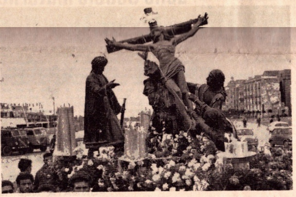
Il Sacro Gruppo della Sollevazione del ceto dei falegnami

TRAPANI - La Processione dei Misteri, edizione 1971, si è conclusa al centro di inimitabili polemiche. Migliaia di fedeli si sono stretti attorno ai Sacri Gruppi per seguire quella che a Trapani costituisce la più bella manifestazione religiosa e folcloristica dell'anno. Anche quest'anno, malgrado gli innumerevoli sforzi tenuti dall'Ente Provinciale per il Turismo, dobbiamo purtroppo mettere in evidenza alcune peccchie scaturite dallo scarso interessamento dei consoli di ogni singolo gruppo. La prima cosa che ha subito meravigliato è stata l'insistenza dei portatori di ogni gruppo i quali, come negli anni precedenti, sfidandosi degli avvertimenti dell'Ente organizzativo, hanno continuato a richiedere offerte con le cassette malgrado l'Ente per evitare questo malcostume, provvede ogni anno ad offrire una somma extra. Per quanto riguarda l'itinerario di quest'anno nulla da eccepire, così pure riguardo l'illuminazione, che è stata suggestiva e ha fatto alla città un aspetto misto e raccolto necessario a far sentire maggiormente la passione di Cristo. Lodevolissimo è stato lo schieramento dei sacri gruppi