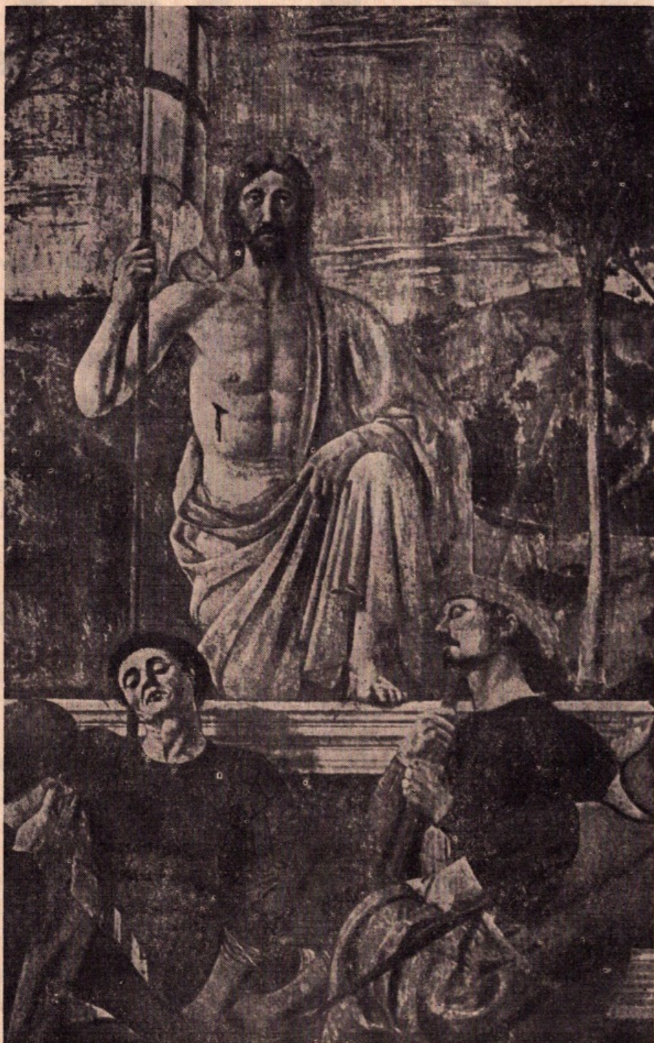
Piero della Francesca: particolare della Resurrezione - Borgo S. Sepolcro

Studiando il tema della resurrezione del Nuovo Testamento si resta anzitutto sorpresi dalla varietà e dalla ricchezza delle forme delle quali la fede nel Risorto si è espressa.