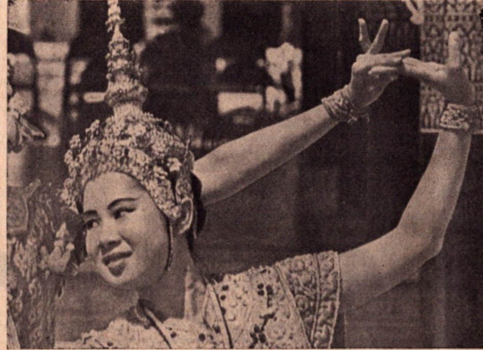
Danzatrice thailandese, nel costume tradizionale, si esibisce durante i festeggiamenti per la chiusura dell'anno cristiano

italiano. Dry o on-the-rock, clienti di tutto il mondo lo esigono per corredare il loro trattamento, e dargli tonno. Il brandy si è internazionalizzato fino a diventare, in un drink che si rispetti, conditio sine qua non.