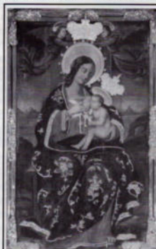
Il dipinto della Madonna prima del restauro

E recentemente terminato il restauro, durato alcuni mesi, del "miracoloso" quadro di Maria S. S.