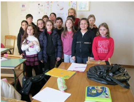
Ragazzi 2 anno comunione e il sito

L'ora di catechismo è un gesto d'amore che la Chiesa rivolge ai ragazzi che incontrano GESU'. " ..dove sono due o tre riuniti nel mio nome, lì sono Io in mezzo a loro" (Mt 18,20). La preparazione di un incontro di catechismo richiede cura e scrupolo ed ogni catechista deve chiedersi: " come posso attirare l'attenzione dei ragazzi?" Vincente è stata, sicuramente, l'idea di presentare, durante l'incontro del 12 febbraio, ad un gruppo di ragazzi del